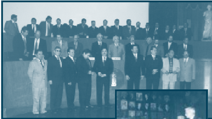
Consejo Nacional de Medicina General en la Academia Nacional de Medicina