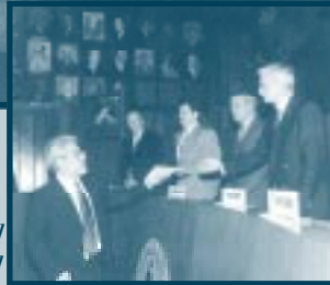
Entrega de Carta de Idoneidad al Consejo Nacional de Medicina General