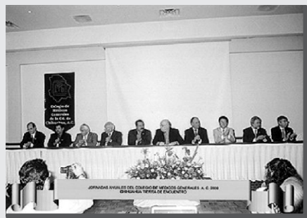
Renovación de la Mesa Directiva del Consejo Nacional de Certificación en Medicina General, A.C.